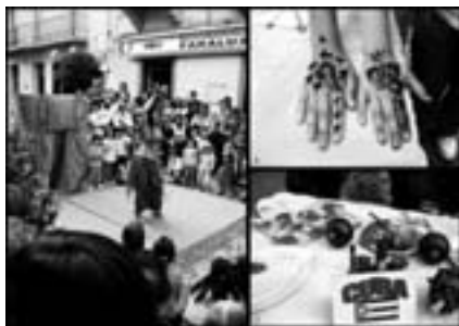
III Jornadas interculturales en Andorra.

Comenzaron las fiestas en Ejulve, en honor a su patrón, San Pascual Bailón. La música fue la protagonista del día.