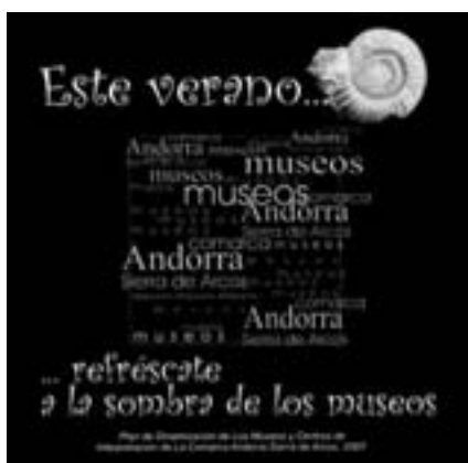
Folleto de la campaña Este verano refréscate a la sombra de los museos , organizada por la consejería de Cultura de la Comarca.