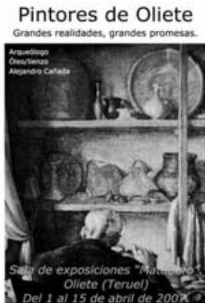
Cartel de la exposición Pintores de Oliete con la que se inauguraba la sala El Matadero de Oliete.

divulgación de la Red European GEO-PARK, etc.