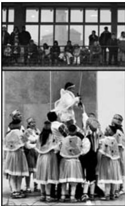
Representación del Dance de San Blas en el pabellón polideportivo de Alloza.