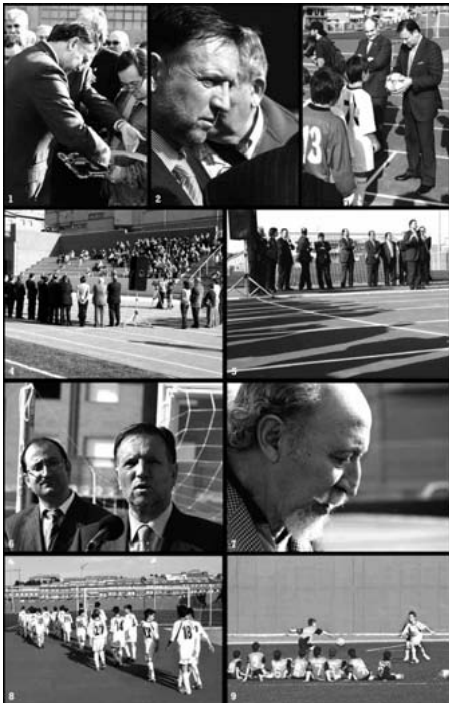
Inauguración de las pistas de atletismo de Andorra por el Presidente de Aragón Marcelino Iglesias y distintas autoridades. Fotos 1, 2, 3, 5 y 6. Marcelino Iglesias en distintos momentos de la inauguración. 4. Vista del público que asistió al acto. 7. Imagen del reputado atleta aragonés Pedro Pablo Fernández. 8 y 9. Equipos infantiles que estrenaron las instalaciones.