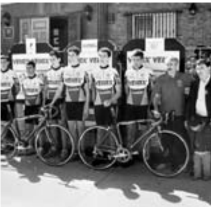
Presentación del equipo ciclista Velox .

Tras 18 años sin albergar competiciones oficiales de escuelas de ciclismo, Andorra volvió a ser escenario de una prueba ciclista en categoría cadete: I Subida a San Macario, con presencia de 50 corre-