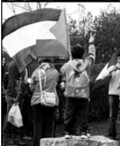
Celebración del Día de la Tierra Palestina en Andorra.

de un olivo", se dio por terminada la celebración.