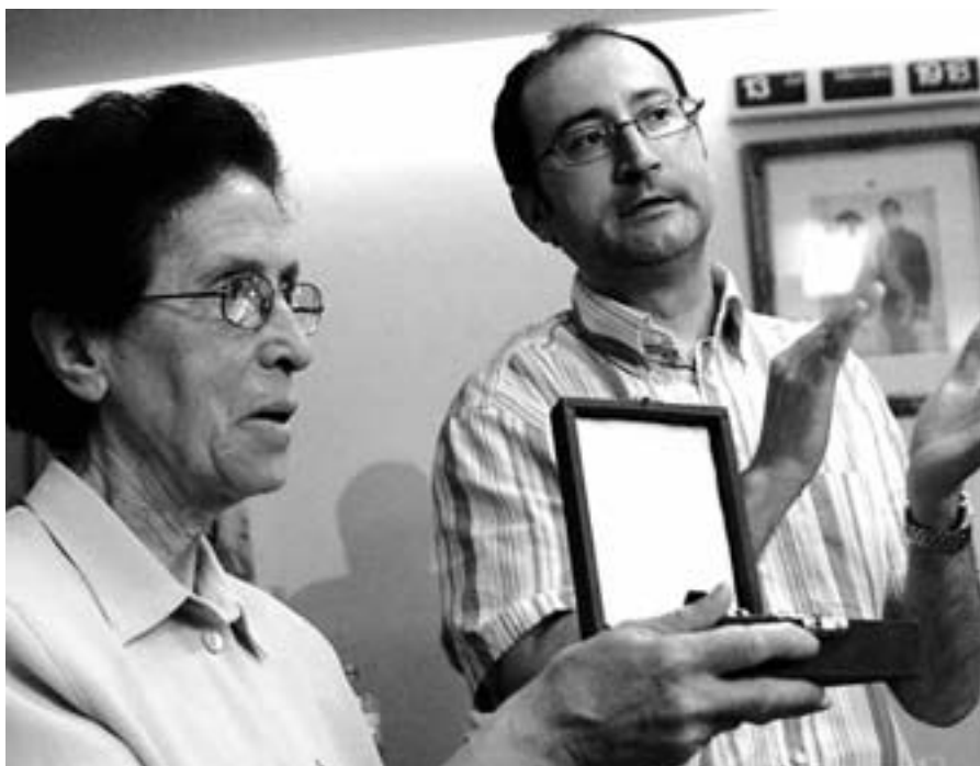
Un momento del pleno del Ayuntamiento en el que se concedió la Medalla de oro de Andorra a las Hijas de la Caridad.