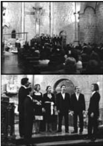
Concierto del grupo vocal británico Voces 8 en la iglesia parroquial de Andorra.