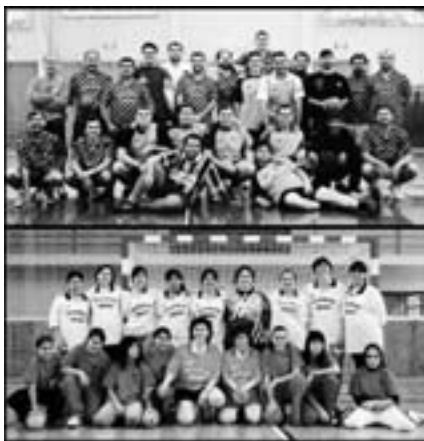
Celebración del Día del Balonmano.

Se disputó en Zaragoza la fase final del campeonato de Aragón de tenis de mesa, con destacada presencia de jugadores y jugadoras de Oliete, grupo que se entrena en la asociación cultural Oblites y que consiguió subir de categoría.