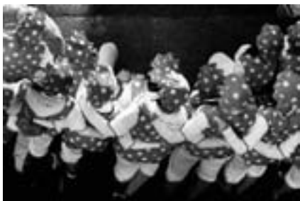
Imagen de los Carnavales de Andorra.

Celebración del Carnaval. Un concurso de disfraces y degustación de chocolate con “raspao” durante el concurso fue una buena forma de entretener la espera hasta el desfile, la cena y el baile. En el Hogar de las Personas Mayores de Andorra, se preparó con un taller de disfraces y diversos actos festivos.