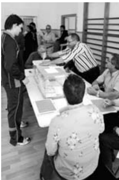
Mesa electoral del Colegio San Jorge correspondiente a las elecciones locales y autonómicas celebradas el 27 de mayo.

En Val de Serrana, se desarrolló un concurso de pesca organizado por ADYC.