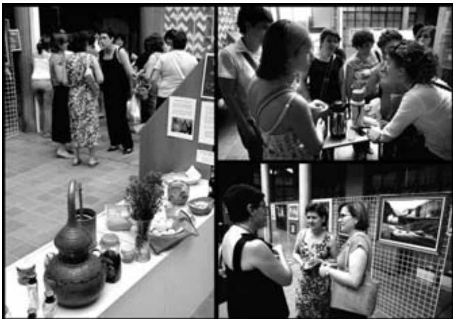
Exposición fin de curso con muestras de las actividades de distintos talleres de la Universidad Popular de Andorra.