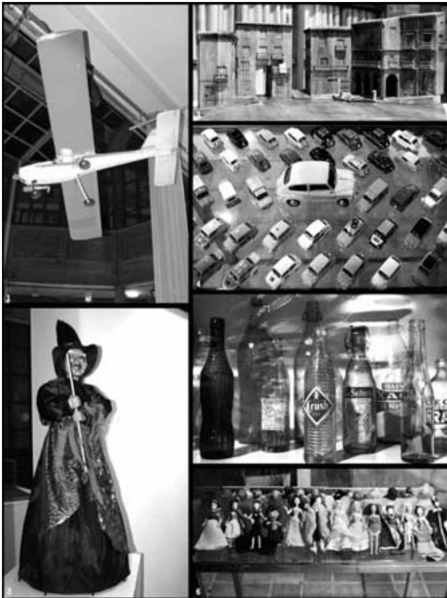
Exposición de coleccionismo en el patio de la Casa de Cultura de Andorra.