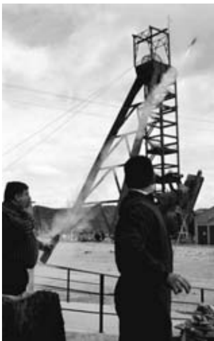
Celebración del Día de Santa Bárbara en el Pozo San Juan.

Ariño también tuvo Misa, bilingüe, en español y rumano, y procesión y ofrenda de flores a Santa Bárbara, con la actuación del coro de Ariño. La comida de hermandad y una revista fueron las actividades organizadas en esta ocasión por la