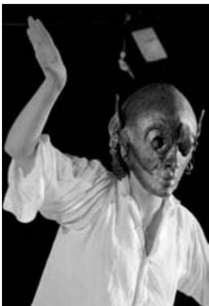
Teatro sobre Pablo Gargallo en el IES Pablo Serrano de Andorra.

Actuación del Grupo Teatral Circunstanxias con su obra Mujeres de armas tomar , en el salón de actos del IES Pablo Serrano de Andorra, con motivo de la celebración del Día Internacional de la Mujer. Se organizó una ruta de transporte desde las demás poblaciones de la Comarca para asistir a la actividad.