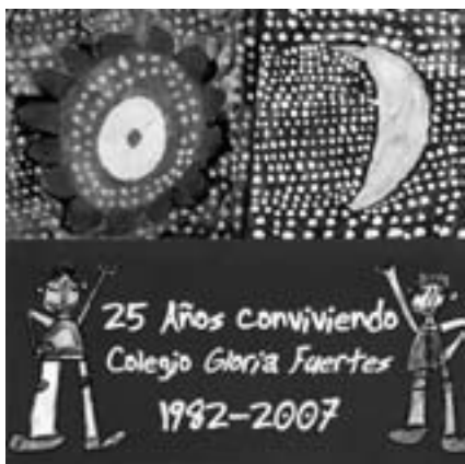
Programa de actos de la celebración de los 25 años del Colegio Gloria Fuertes.