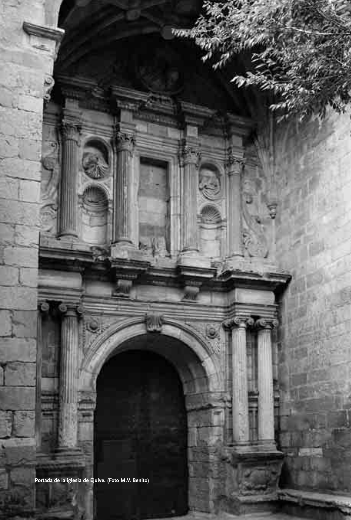
Portada de la iglesia de Ejulve.