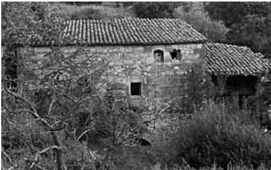
Molino Alto.