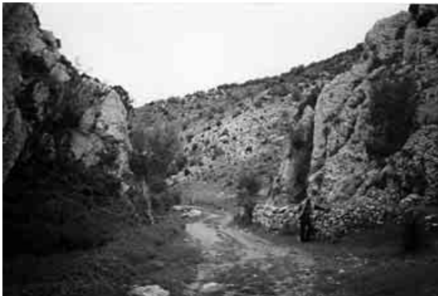
Los Barrancos.

mentación que nos puedan aclarar el desenlace concreto de este enfrentamiento de intereses entre la villa de Ejulve y el Capítulo Eclesiástico por el control de las cuentas municipales. El clero ejulvino, de forma mancomunada, fue acumulando propiedades y rentas –también alguno de sus miembros como el citado Mn. Lorenzo Azcón acumuló a lo largo de su vida un importante patrimonio personal–pero sus rentas fueron decayendo con el paso de los años y muchos de los censos sobre particulares resultaron incobrables. Por su parte, el Ayuntamiento, según la documentación que hemos podido consultar, un siglo más tarde seguía arrastrando un endeudamiento que se hallaba muy por encima de sus capacidades recaudatorias.