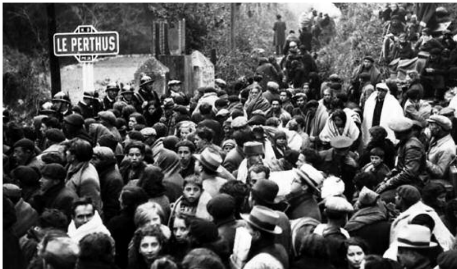
Republicanos llegando a Le Perthus.

aunque solo sea como una muestra estadística.