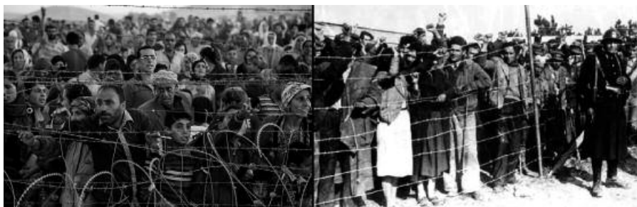
A la izquierda refugiados sirios (2016) y a la derecha refugiados españoles (1939).