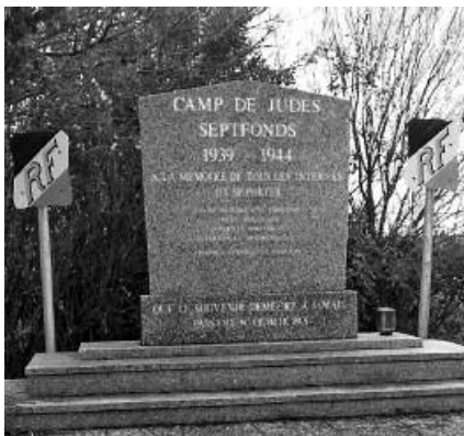
Monumento en Septfonds.