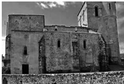
Calle e iglesia de Oradour-sur-Glane en la actualidad.