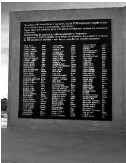
Memorial en el campo de Bram.