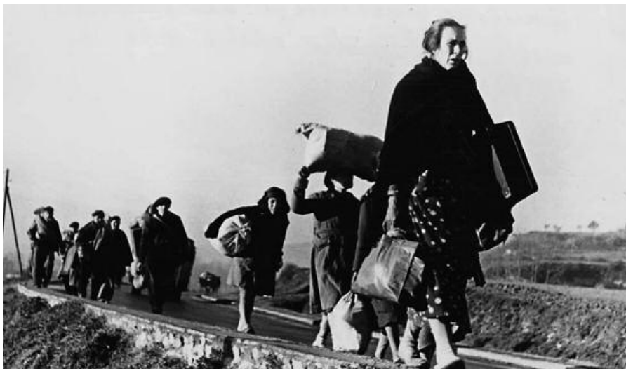
Republicanos civiles durante la retirada.

refugiados españoles que permanecieron en Francia? Hubo numerosísimas defunciones, pero su número es difícil, si no imposible de calcular. Más de 10.000 desaparecidos, seguramente. Y esa magnitud parece ser un mínimo. Quedaría por calcular con precisión, para cada región, para cada campo, para cada maquis, el número conocido de defunciones. Es inútil hinchar las cifras: ya son considerables. A la llegada a Francia, la mortalidad fue importante por el deficiente estado físico de los refugiados, por las heridas de la guerra, las condiciones muy precarias del alojamiento en Francia. Las pérdidas fueron muy numerosas en las CTE implicadas en la batalla de Francia, en la expedición de Narvik, en los campos alemanes, también en los maquis y en los diversos terrenos de operaciones de la Legión Extranjera y de los Regimientos de Marcha 2 .