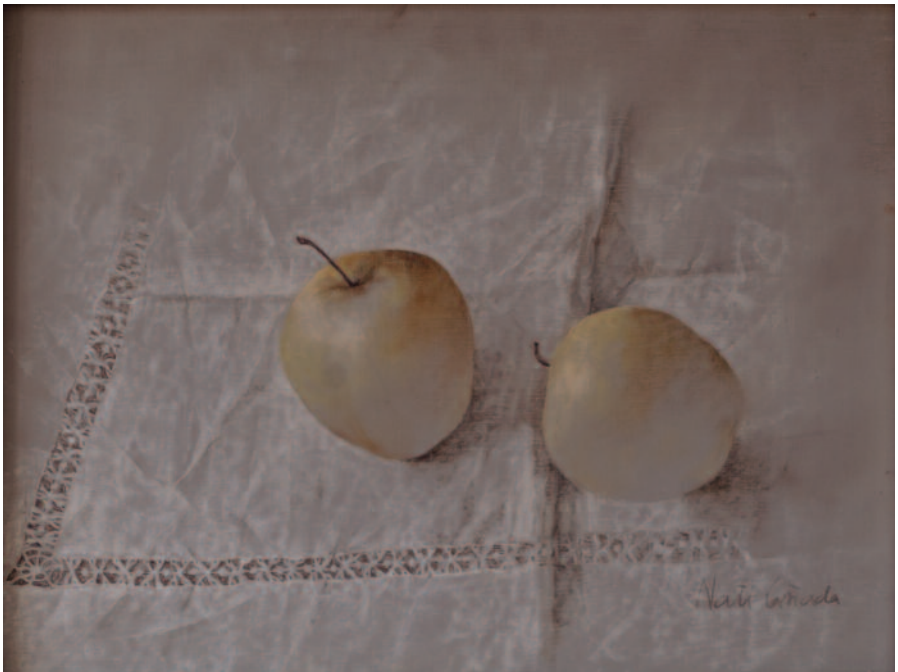
Nati Cañada. Bodegón de manzanas , ayuntamiento de Oliete.