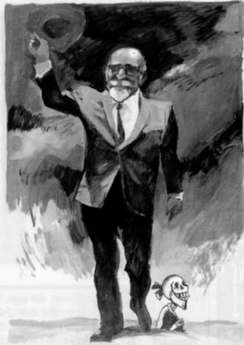
Sender, ya mayor, visto por Cano con una referencia a las calaveras del pintor mejicano Posada.

dad y lo que nos está pasando a todos. Además esto no se puede hacer con el arte de una forma tan inmediata y tan legible, por eso yo ahí me siento muy a gusto y si encima me pagan, pues mejor todavía.