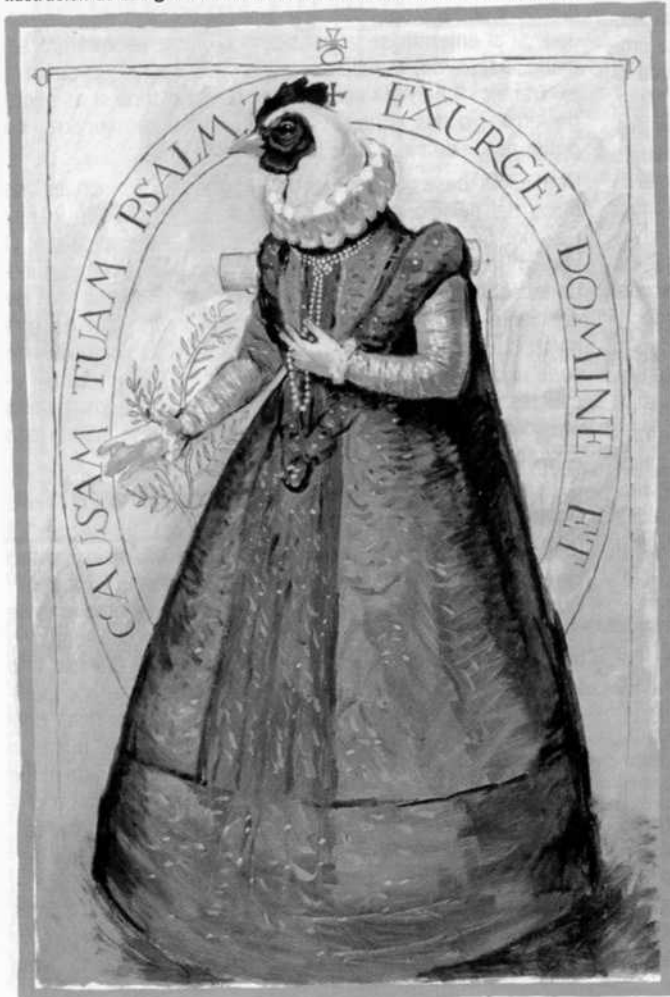
Ilustración de Las gallinas de Cervantes, uno de los relatos de Sender.

Le he echado un vistazo y lo veo bastante bien, quizá de márgenes por arriba y por abajo anda un poco escaso, por los lados creo que va bien. Luego lo que más me ha chocado es que algunos titulares son muy largos y no están lo suficientemente destacados para leerlos bien. Así como el resto me parece que está muy bien maquetado y ordenado, un cuerpo de letra que se ve. En general me gusta, pues los títulos tan largos se deben a los autores y es el maquetador el que se ve con esos problemas a resolver. Una de las cosas que me ha gustado mucho son las fotografías, muy bien reproducidas y con mucha calidad. En general pienso que está muy bien.