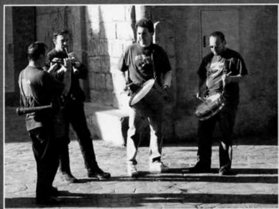
Los gaiteros de Estercuel amenizaron la mañana tocando dulzainas y tambores por las calles de Alloza mientras acompañaban al público a los diversos actos programados.