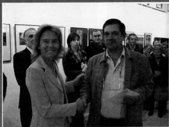
La Subdelegada del gobierno en Teruel, M a Victoria Álvarez, entrega uno de los premios del II Concurso de Fotografía Comarca de Andorra-Sierra de Arcos en el Centro de Interpretación de la Cultura Ibérica, en cuyos locales se expusieron las fotografías seleccionadas.