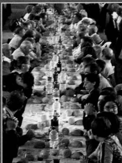
La comida de hermandad en el polideportivo reunió a cerca de mil comarcanos, muestra del éxito de participación que registró este año el Día de la Comarca.