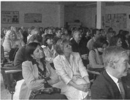
Todos los miembros de la comunidad educativa pudieron disfrutar de una agradable mañana escuchando a los distintos miembros que componían la mesa.

d urante el curso 2004-05 se ha celebrado el XXV aniversario el CP Juan Ramón Alegre.