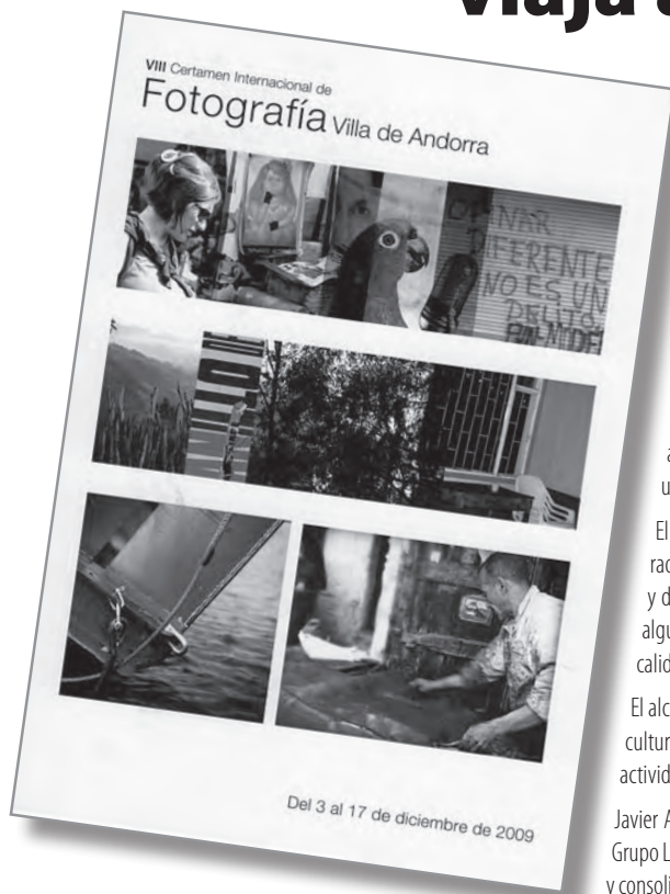
Anuncio de la exposición del VIII Certamen Internacional Villa de Andorra en la sala Barbasán.

La Sala Barbasán de la CAI, en Zaragoza, fue escenario -durante quince días del mes de diciembre de 2009- de la exposición de las fotografías seleccionadas en la edición VIII del Certamen Internacional de Fotografía Villa de Andorra.