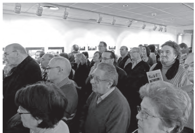
Aspecto de la sala, a rebosar de público, en el momento de la inauguración.