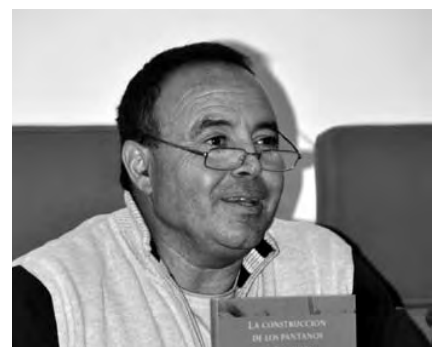
Ángel Calzada, presidente de la Comarca.