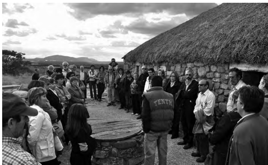
El guía de la ciudad celtibérica de Numancia ante una de las viviendas reconstruidas.

El motivo fue visitar la exposición “Las Edades del Hombre” en su decimosexta edición. Paisaje interior era el título elegido en esta ocasión por la organización de la muestra, perteneciente a los obispos de Castilla-León. Más de 200 obras expuestas –pinturas, esculturas, códices, orfebrería-restauradas y traídas de todas las diócesis, además de las correspondientes a la catedral de Soria, el propio marco de la exposición junto con el Claustro, un ejemplo de románico castellano, iniciado a mediados del siglo XII y concluido a principios del XIII. Las obras fundamentales de la catedral: el retablo mayor, del siglo XVI, del maestro Francisco del Río; el retablo de San Nicolás, plateresco, de mediados del XVI, con influencias de la Escuela de Valladolid, y de Felipe Vigarny; y el retablo de San Miguel, del siglo XVIII, formaban parte destacada de la visita.