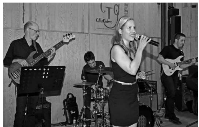
Actuación del grupo de jazz Night Traveller Quartet.