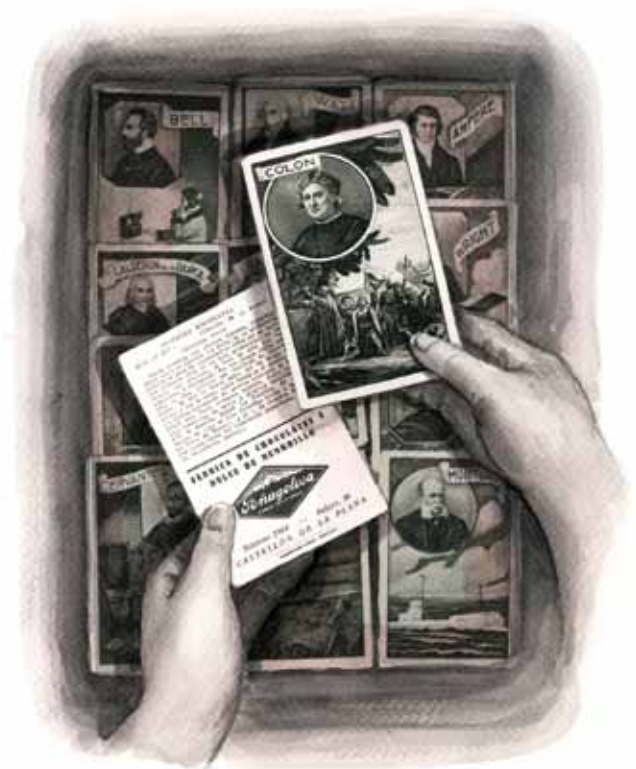
Cromos de los chocolates Peñagolosa (acuarela y retoque digital). Jesús Gómez