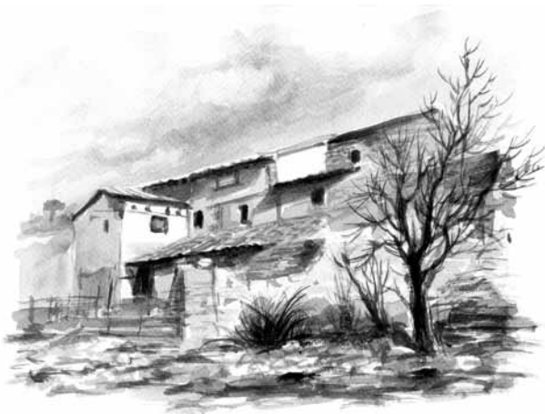
Masadas de la Solana (acuarela y retoque digital). Jesús Gómez