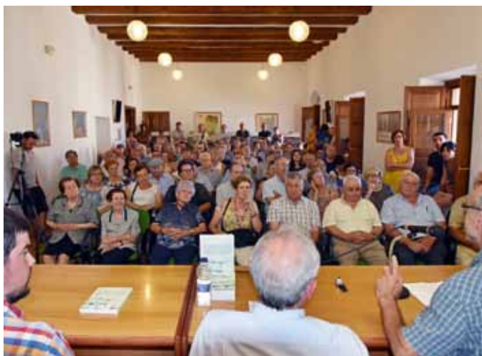
El libro fue presentado el 21 de agosto en el ayuntamiento de Ejulve en un acto que contó con numeroso público, como se puede apreciar en la fotografía.