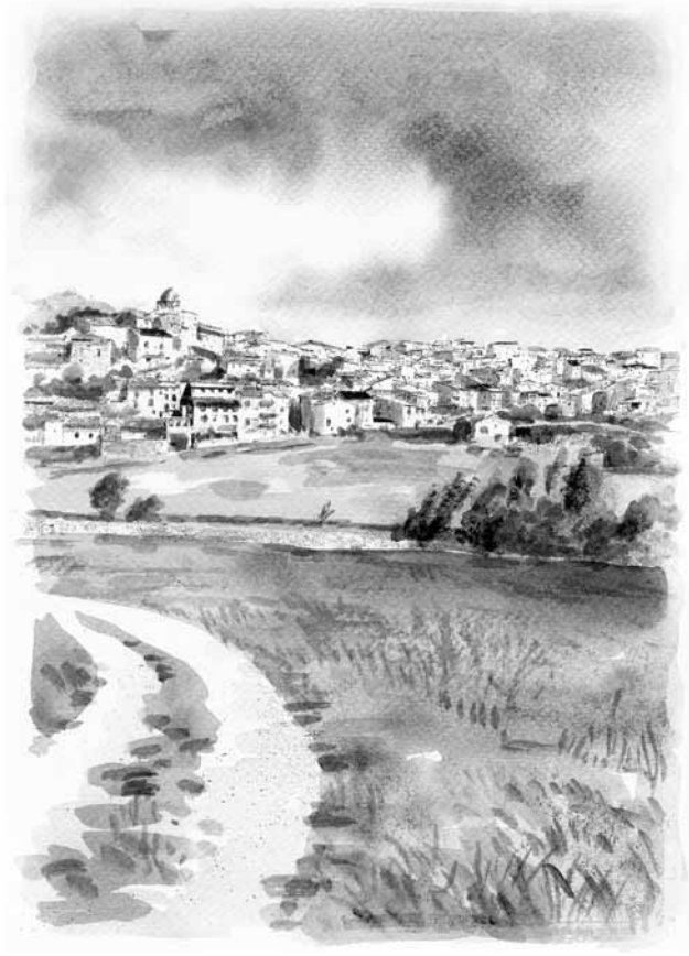
Ejulte (acuarela y retoque digital). Jesús Gómez

Lectura totalmente recomendable por su sencillez y, sobre todo, amena y muy cercana a las zonas rurales y a nuestra comarca.