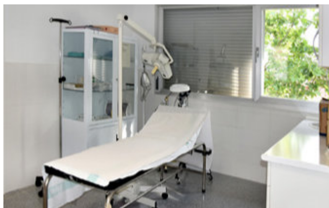
Quirófano en una consulta