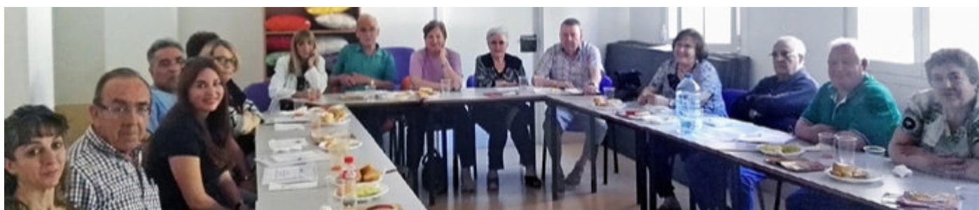
Sesión de formación en el Centro de Salud