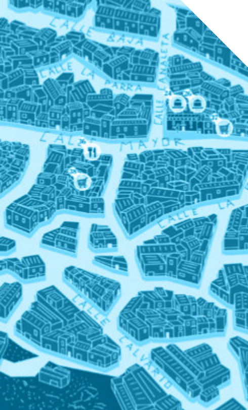
Callejero de Oliete