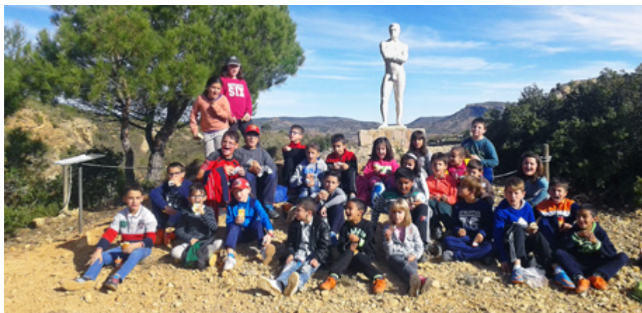
Visita escolar al parque escultórico.

En 2011 se realizaron unos trabajos de acondicionamiento del parque que se inauguraron el 23 marzo. Entre las mejoras efectuadas figura un sistema de iluminación, ampliación de la zona empedrada, una nueva acera para mejorar el paseo y un área recreativa. Estas obras fueron subvencionadas por la Fundación Endesa, Adibama y la Diputación provincial.