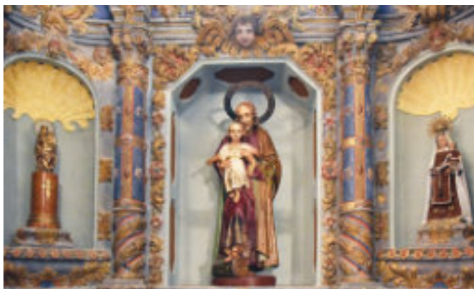
▲ Detalle del altar de San José. Primer cuerpo de la iglesia, de estilo tardorrománico. ►