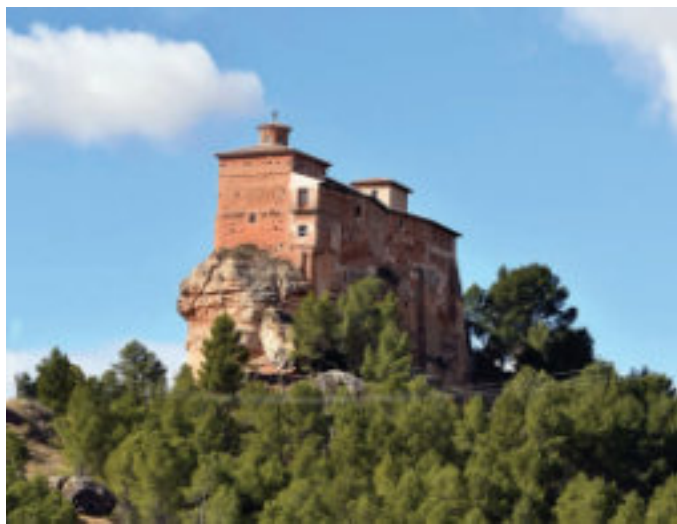
Santuario de Nuestra Señora de Arcos.