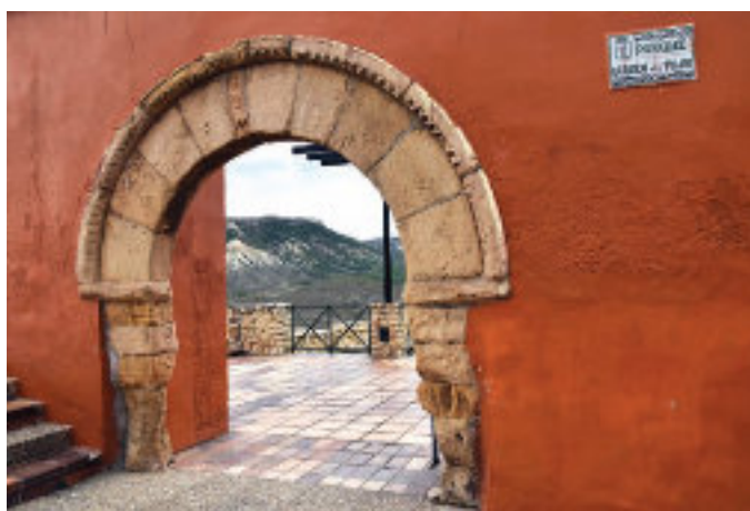
Portada románica de la ermita de la Virgen del Pilar

A principios de los años 1980, la empresa SAMCA contribuyó a recuperar los alrededores de esta ermita, que, como decimos, es un estupendo mirador. Además de pavimentar y ajardinar el espacio, se consolidó el arco de entrada y parte de la fachada lateral. Aunque la intervención no es idónea desde el punto de vista de la restauración artística, ha preservado la portada de medio punto, de marcado estilo románico, con grandes dovelas y molduras talladas con puntas de diamante.