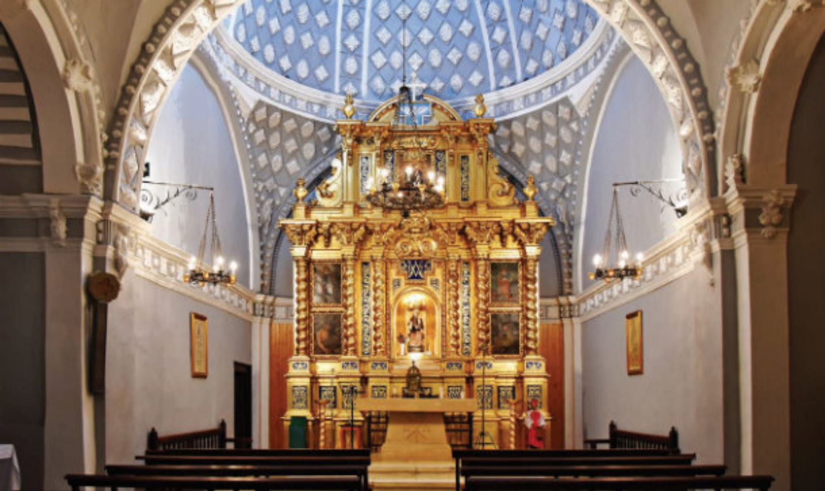
Capilla mayor del santuario.