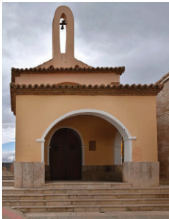
Escalinata y atrio de la ermita de Santa Bárbara.

Las fiestas en honor de santa Bárbara fueron decayendo hasta que en la primera década del siglo XXI diversas asociaciones del pueblo, sin desatender la raíz religiosa, las impulsaron desde un punto de vista social. En la actualidad, en la ermita se reparten los ramos de olivo bendecidos el Domingo de Ramos y el día de la festividad de la santa hay ofrenda y procesión, charlas y conferencias, comida de hermandad y concurso de guiñote, entre otros actos.