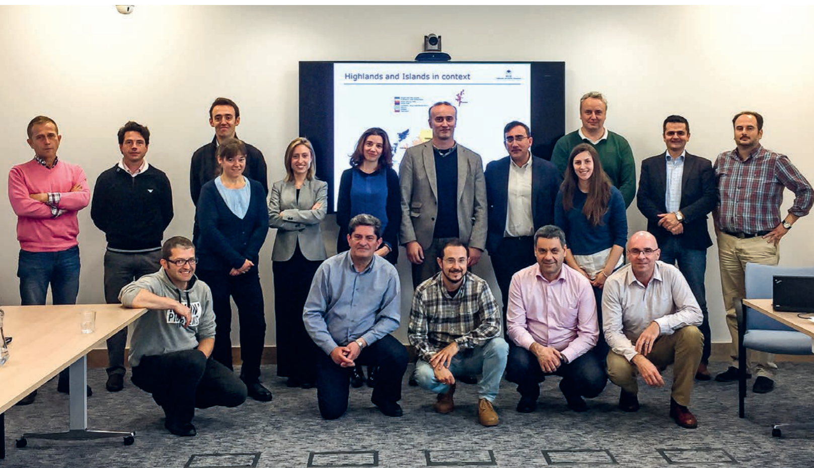
Participantes en el grupo de visita a Highlands and Islands Enterprise (HIE), 2-4 de mayo de 2017.

Guillermo Cano de Guadalajara