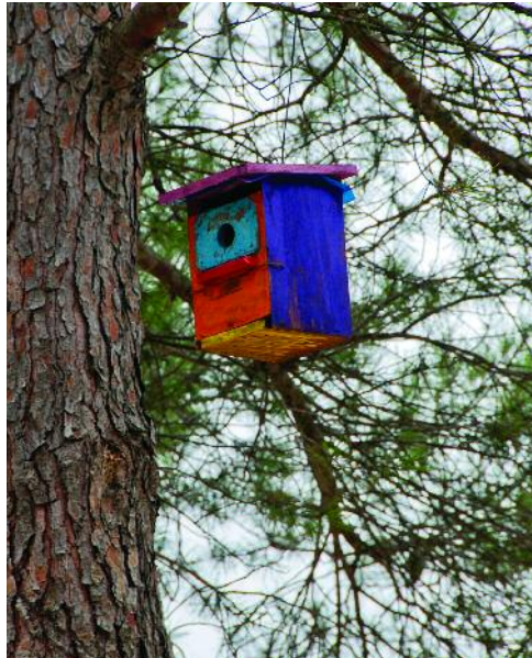
Caja nido pintada por los escolares de Ejulve