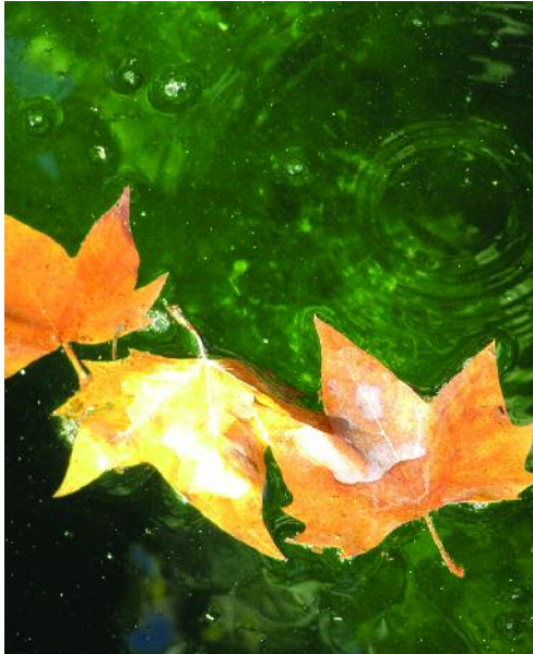
Otoño en Los Baños (Ariño)

VV. AA. Los bosques ibéricos. Una interpretación geobotánica , Barcelona, Planeta, 2005.