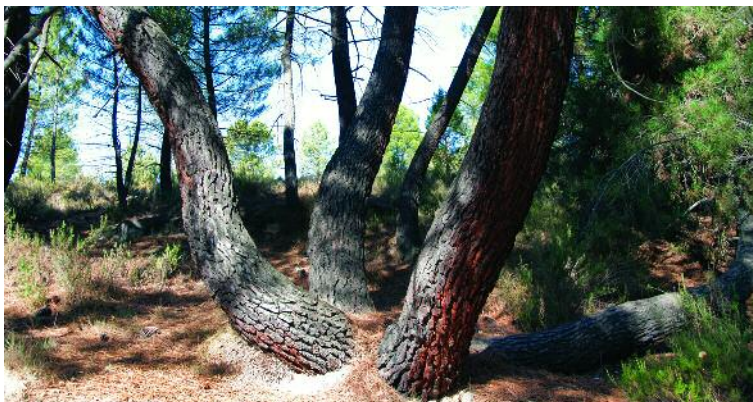
Pino rodeno de cuatro garras [Estercuel]