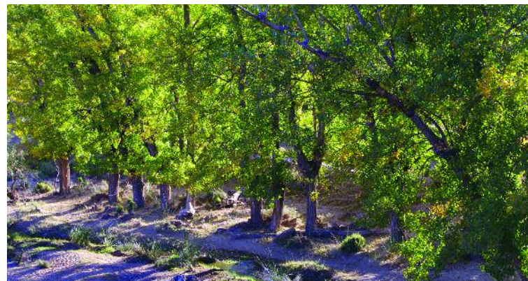
Chopos en la ribera del Estercuel [Estercuel]