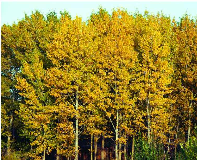
Chopera amarilla (Oliete)

A principios de los años cincuenta se realizaron empalizadas con troncos para nivelar el terreno y poder plantar y cultivar chopo negro ( Populus nigra ). Estas repoblaciones, llevadas a