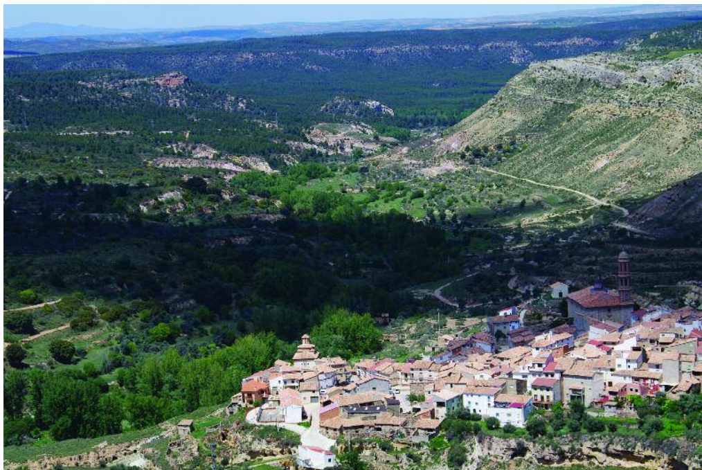
Finca de La Codoñera vista desde Crivillén

forestales fueron más que nada una forma de transferir rentas al mundo rural, un instrumento para la lucha contra el paro rural.