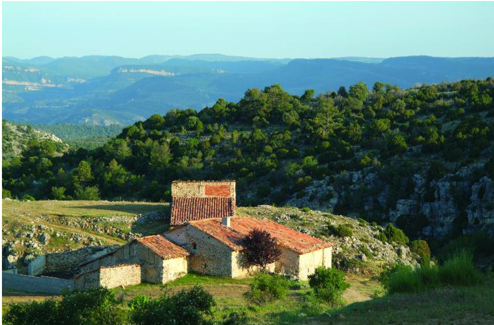
Espacio de Interpretación del Territorio Masías de Ejulve

Cuando se creó el ICONA, este se dedicó a administrar grandes extensiones de bosques, procedentes de estas compras-expropiaciones, formados principalmente por especies pináceas de crecimiento rápido, cuya función primera era la de frenar la erosión. En los años ochenta, junto con las competencias sobre montes, el Gobierno de Aragón recibió todo este