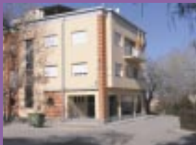
Sede de la Comarca en las antiguas oficinas de Endesa en Andorra. La Comarca ha adquirido la histórica Casa de los Alcaïnes (vid. pág. 47) como futura sede.