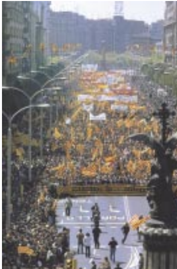
Manifestación del 23 de abril de 1978 por el Paseo de la Independencia de Zaragoza en reivindicación de la autonomía aragonesa