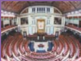
Congreso de los Diputados en Madrid