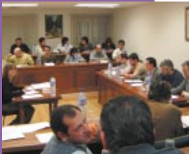
Reunión del Consejo Comarcal en el salón de plenos de la Comarca