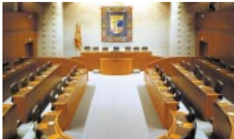
Las Cortes de Aragón en Zaragoza