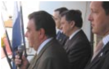
Ayuntamiento (Alcalde Ariño), Comarca (Presidente de Andorra-Sierra de Arcos) y Diputación (Presidente de la Diputación Provincial de Teruel).