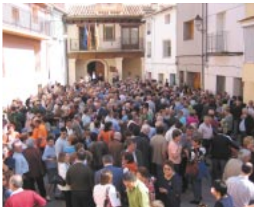
Día de la Comarca en Ariño, 2005.

la campaña cultural comarcal ( De pueblo en pueblo ).